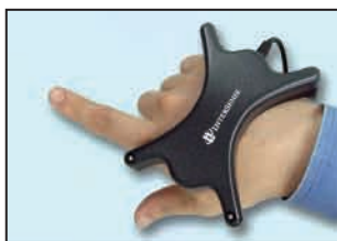
MicroTrax Hand Tracker