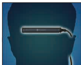
MicroTrax Head Tracker